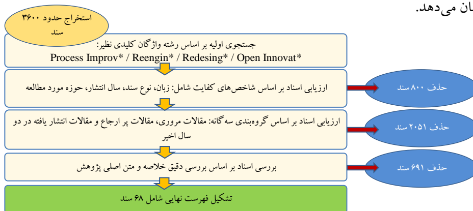
شکل ۱. فرایند انتخاب مجموعه مطالعات نهایی مورد بررسی

سپس موارد تکراری از گروه‌بندی‌ها کنار گذاشته شد. در نهایت خلاصه یا متن کامل اسناد بدقت بررسی شده و موارد غیر مرتبط حذف گردید. در مجموع ۶۸ مطالعه تحت بررسی نهایی قرار گرفت. این مطالعات تنها مواردی بودند که به مفهوم «نوآوری فرآیندی باز» پرداخته و مشمول شاخص‌ها و گروه‌بندی‌های فوق شدند. شکل ۱ فرایند انتخاب مطالعات نهایی را نشان می‌دهد.