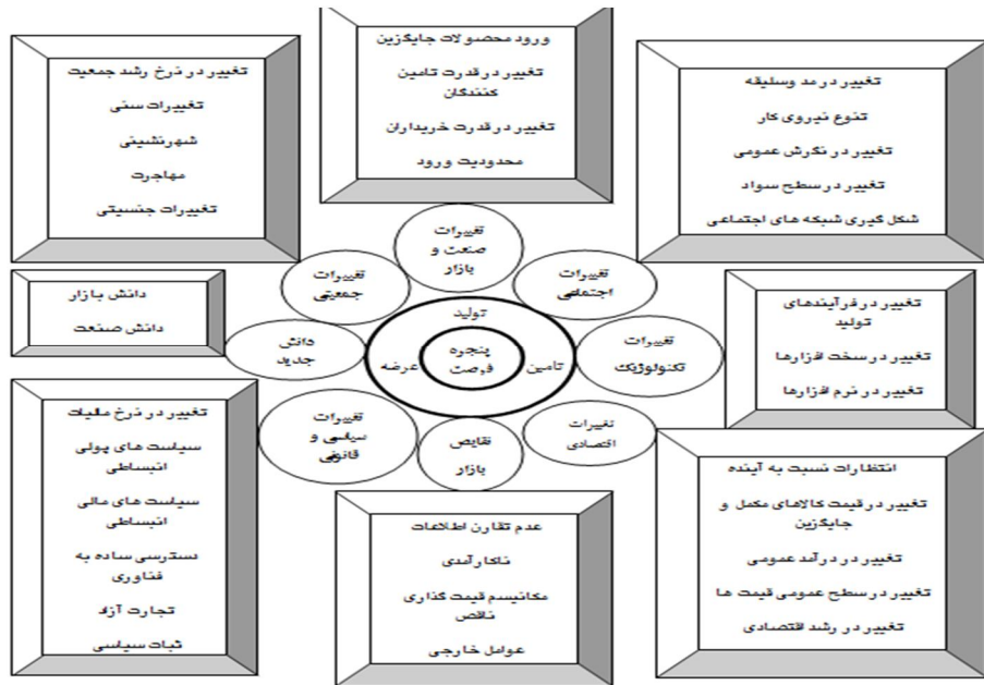
شکل 2. الگوی پنجره فرصت کارآفرینی در زنجیره تأمین

تغییرات محیطی بیان شود. این تغییرات عبارتند از: تغییرات اقتصادی: شامل مفاهیم انتظارات نسبت به آینده، تغییر در قیمت کالاهای مکمل و جایگزین، تغییر در درآمد عمومی، تغییر سطح عمومی قیمت‌ها و تغییر در رشد اقتصادی. تغییرات سیاسی: شامل تغییر در نرخ مالیات، سیاست‌های پولی و مالی انبساطی، دسترسی ساده به فناوری، تجارت آزاد و ثبات سیاسی.